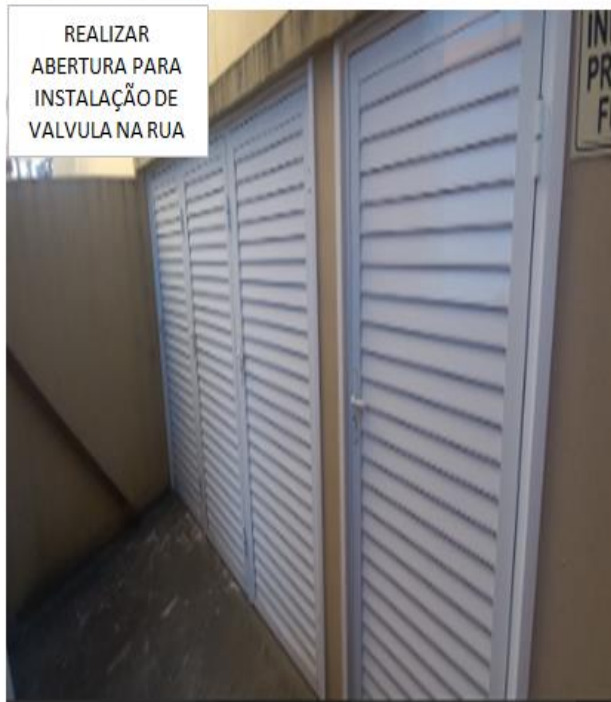
REALIZAR ABERTURA PARA INSTALAÇÃO DE VALVULA NA RUA