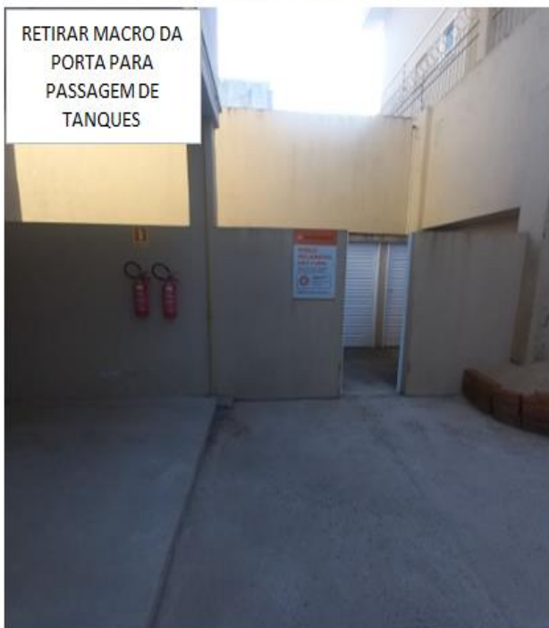
RETIRAR MACRO DA PORTA PARA PASSAGEM DE TANQUES