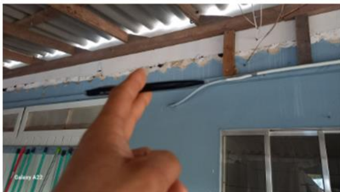
interligação da rede 20mm