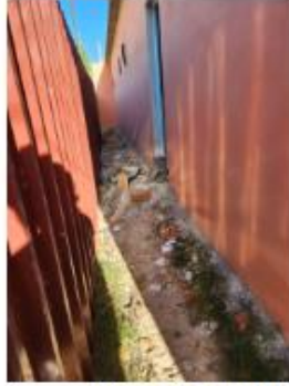
rede rente ao chão