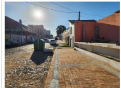
local caminhão abastecimento