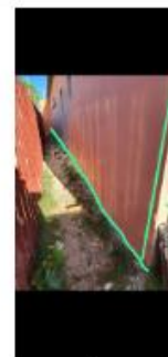
rede para os equipamentos rente ao chão