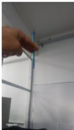
interligação rede existente