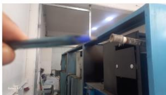
interligação dos pontos