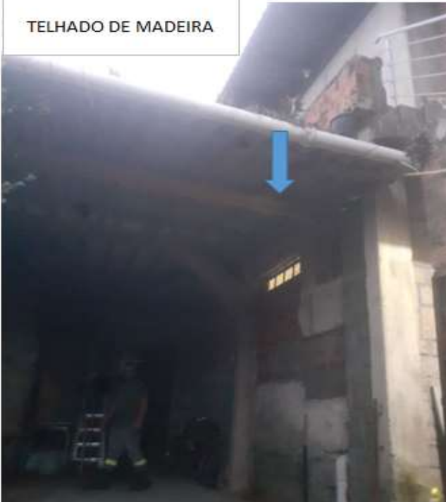
TELHADO DE MADEIRA

RETIRAR TELHADO DE MADEIRA CONFORME APONTADO