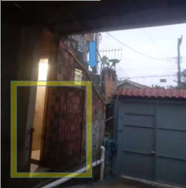
FIOS DE ELETRICA A SEREM REMOVIDOS