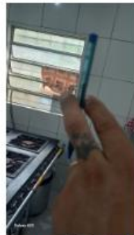
ponto do fogão 6 bocas