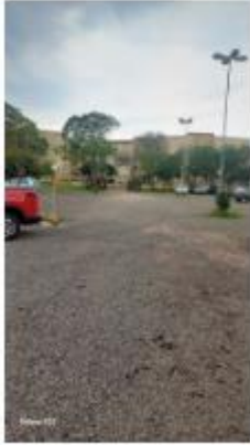
entrada do caminhão