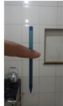
ponto do fogão 4 bocas