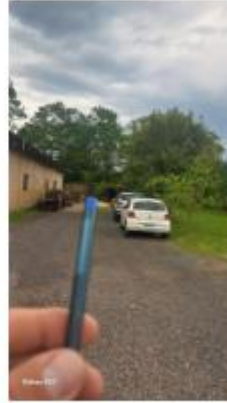
parada do caminhão