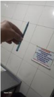
espera do aquecedor