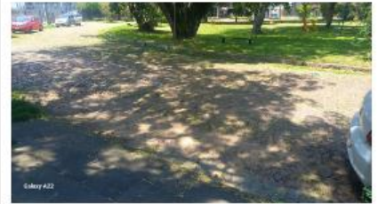
parada do caminhão