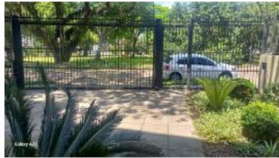
entrada do operador