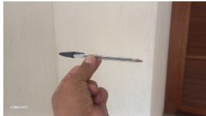
válvula ficará no final da caneta