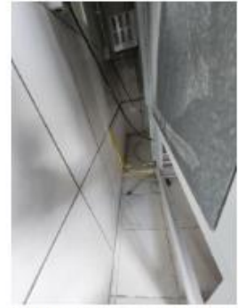
local onde vamos interligar a rede vindo da central nova , atrás dos fornos