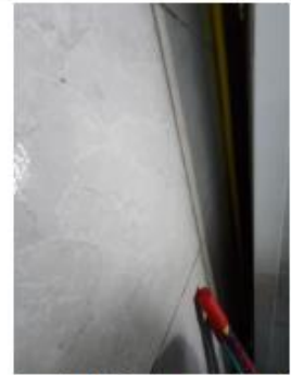
rede atrás da prateleira de pão