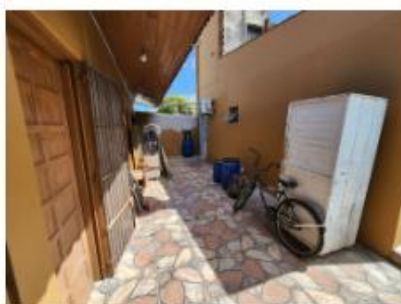
local da central