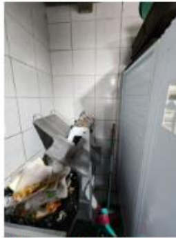
local do ponto do fogão, vamos pegar da rede existente datas da prateleira de pão