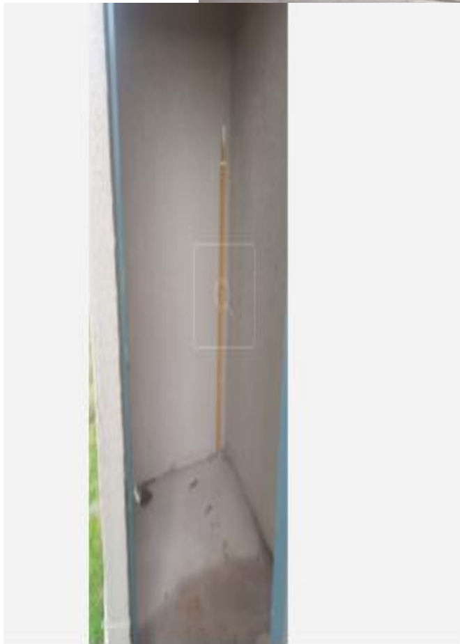
Central torre 1