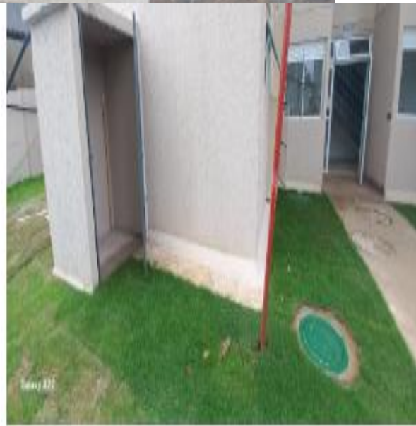
Central torre 1 alimentara ela própria