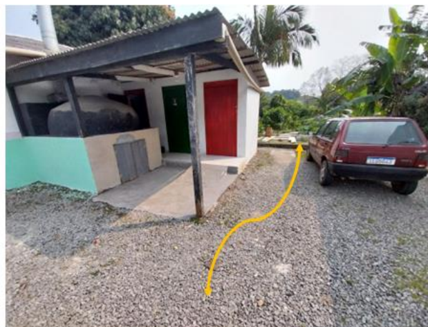
Central 1 B-190