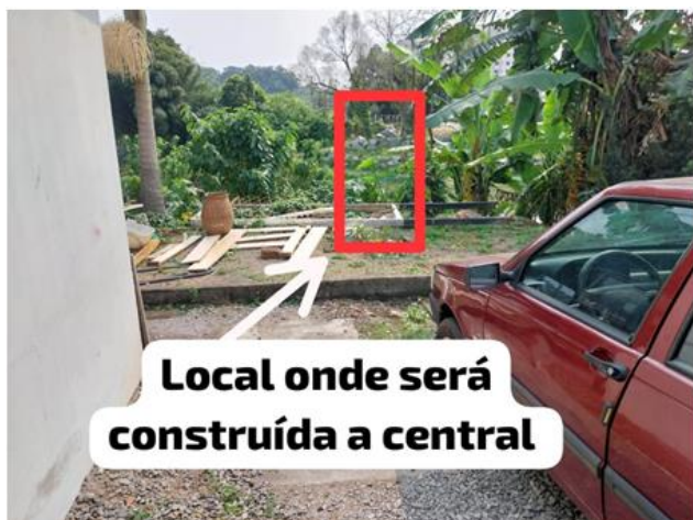
Local onde será construída a central