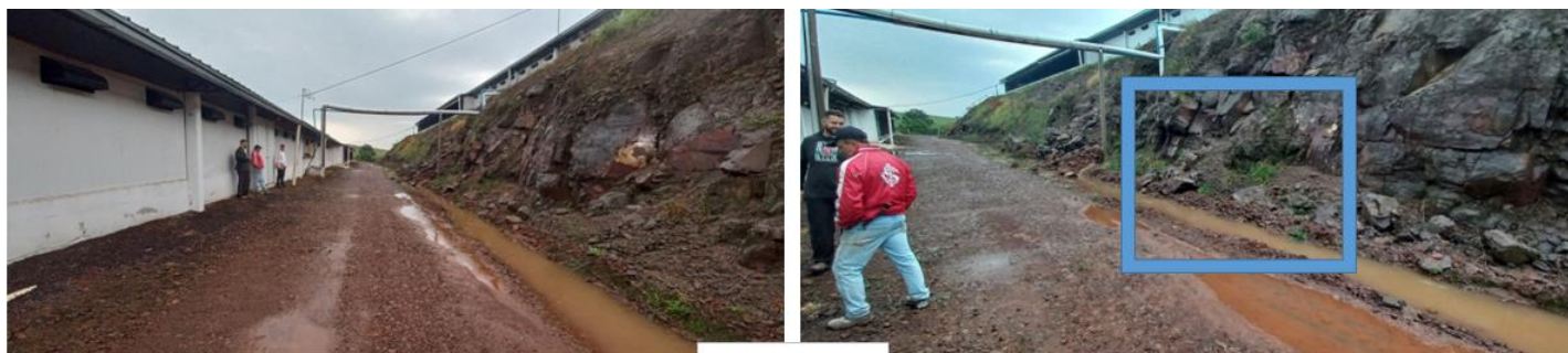
Central 12 B-190