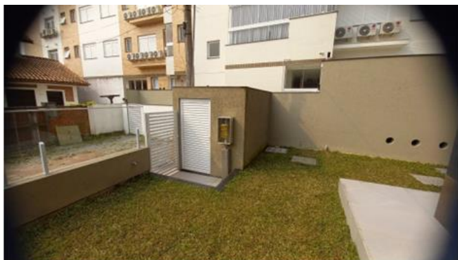
Central 3 B-190