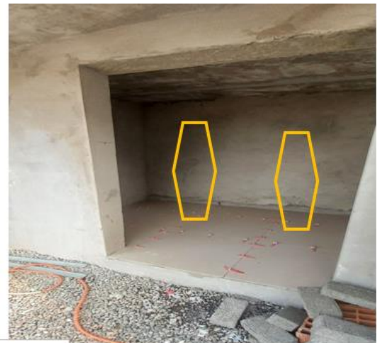
Central 2 B-190