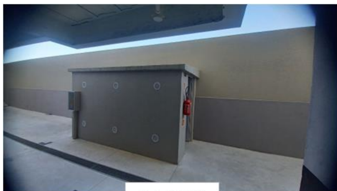
Central 1 B-190