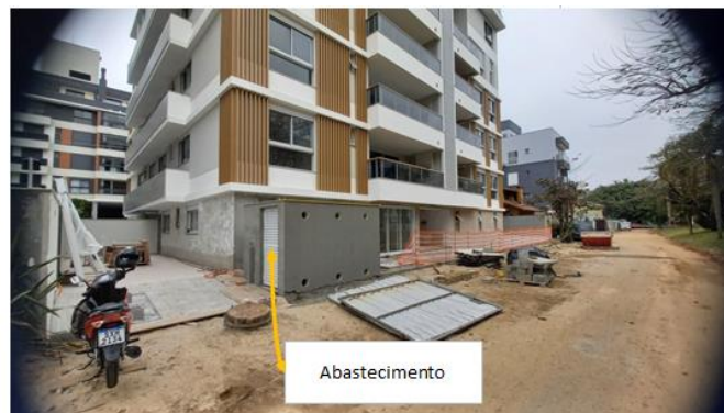
Central 2 B-190