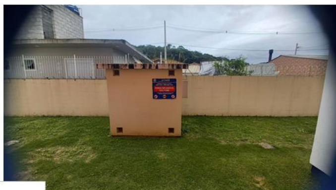
Central 1 B-190