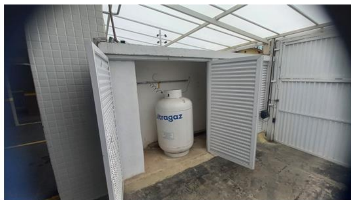
Central 1 B-190