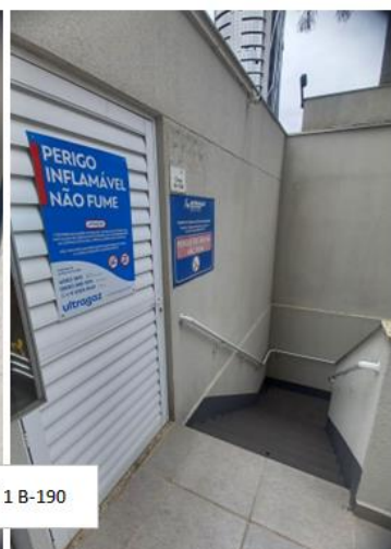
Central 1 B-190