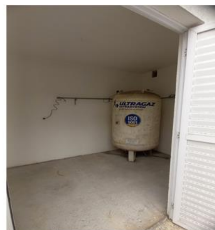
Central 1 B-500