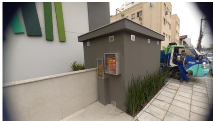
Central 4 B-190