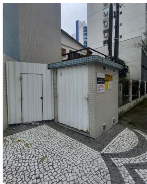
Central 1 B-190