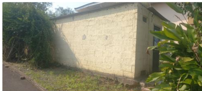
Central 4 B-500