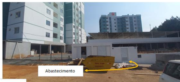
Central 5 B-190