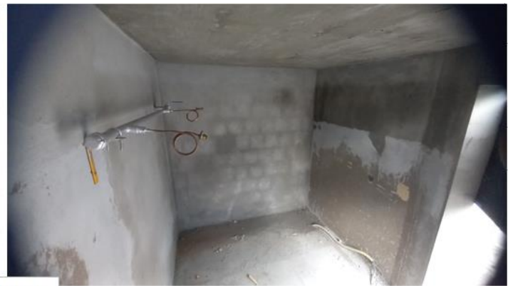
Central 2 B-190