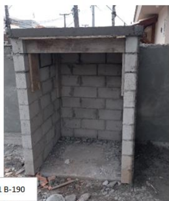
Central 1 B-190