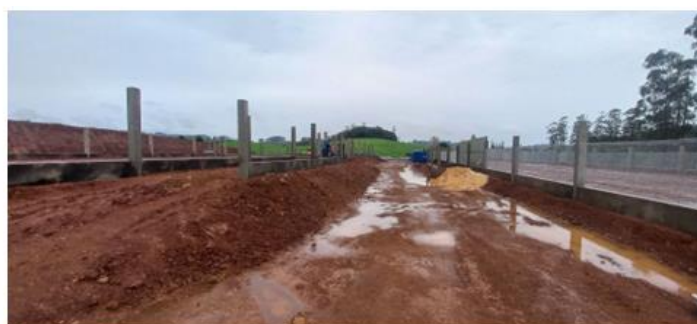
Central 18 B-190