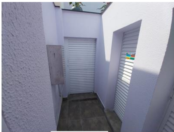
Central 1 B-190