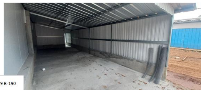
Central 9 B-190