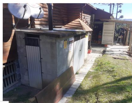
Central 1 B-190