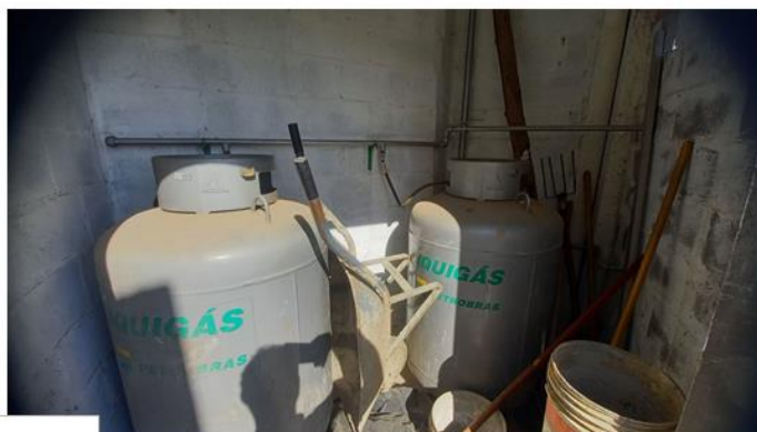
Central 2 B-190