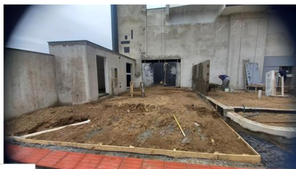
Central 4 B-190