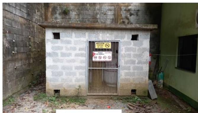
Central 5 B-190