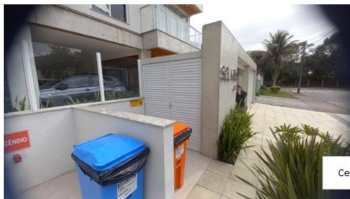
Central 1 B-190