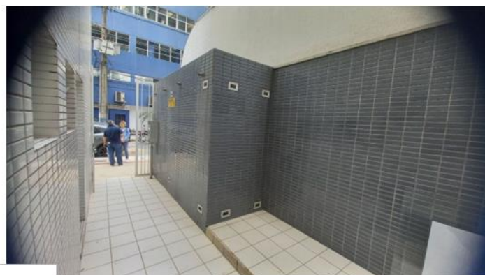
Central 4 B-190