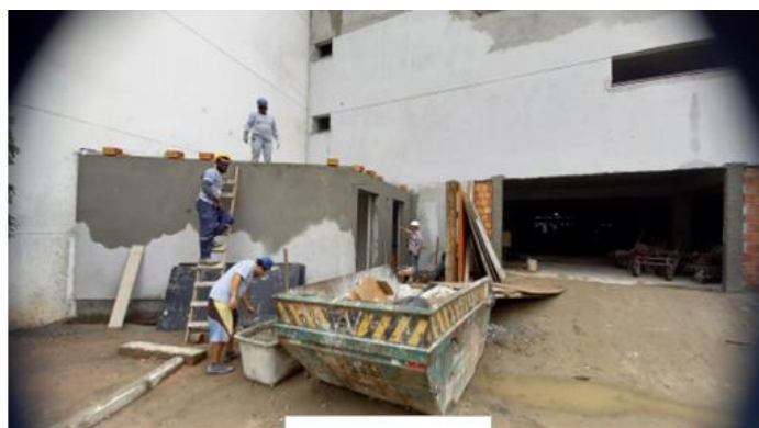
Central 5 B-190